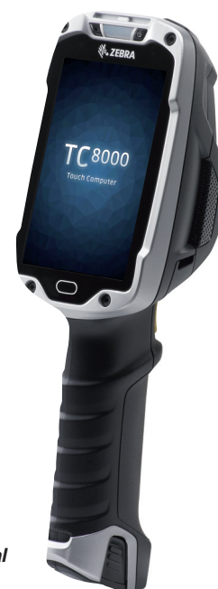
Le terminal TC8000

La montée en puissance de l'OS Android et son adéquation avec les attendus des utilisateurs professionnels ont incité de nombreux constructeurs à investir ce marché porteur. Mais seul Zebra Technologies se détache du peloton : le constructeur capte actuellement 64% des terminaux professionnels fonctionnant sous Android, loin, très loin devant les 8% commercialisés par le numéro 2 du marché, et propose des versions Android récentes. Plusieurs terminaux Zebra sont d'ailleurs déjà référencés via la plateforme « Google Enterprise Recommended », régulièrement complétés par de nouveaux modèles. Une prédominance à mettre notamment en regard avec deux facteurs. D'abord, une fiabilité et une robustesse remarquables, grâce à l'architecture tout-