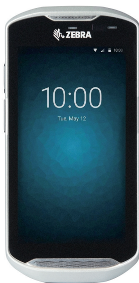
Le terminal TC56

de gestion avancées, y compris en ce qui concerne l'alimentation des terminaux. D'un point de vue sécuritaire, l'adoption généralisée d'Android impactera profondément les pratiques de gestion traditionnelles, et requerra l'accès à de nouvelles compétences ou leur acquisition, pour assurer le déploiement et la gestion du parc de PDA et de terminaux métier.